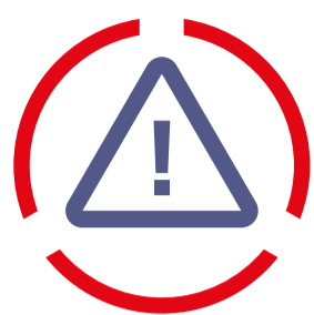
1. RISICOBEBEERSING focus op voorkant veiligheidsketen