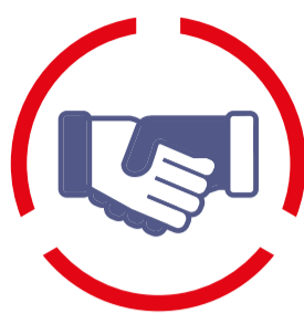
3. SAMENWERKEN op juiste schaal en in juiste netwerken