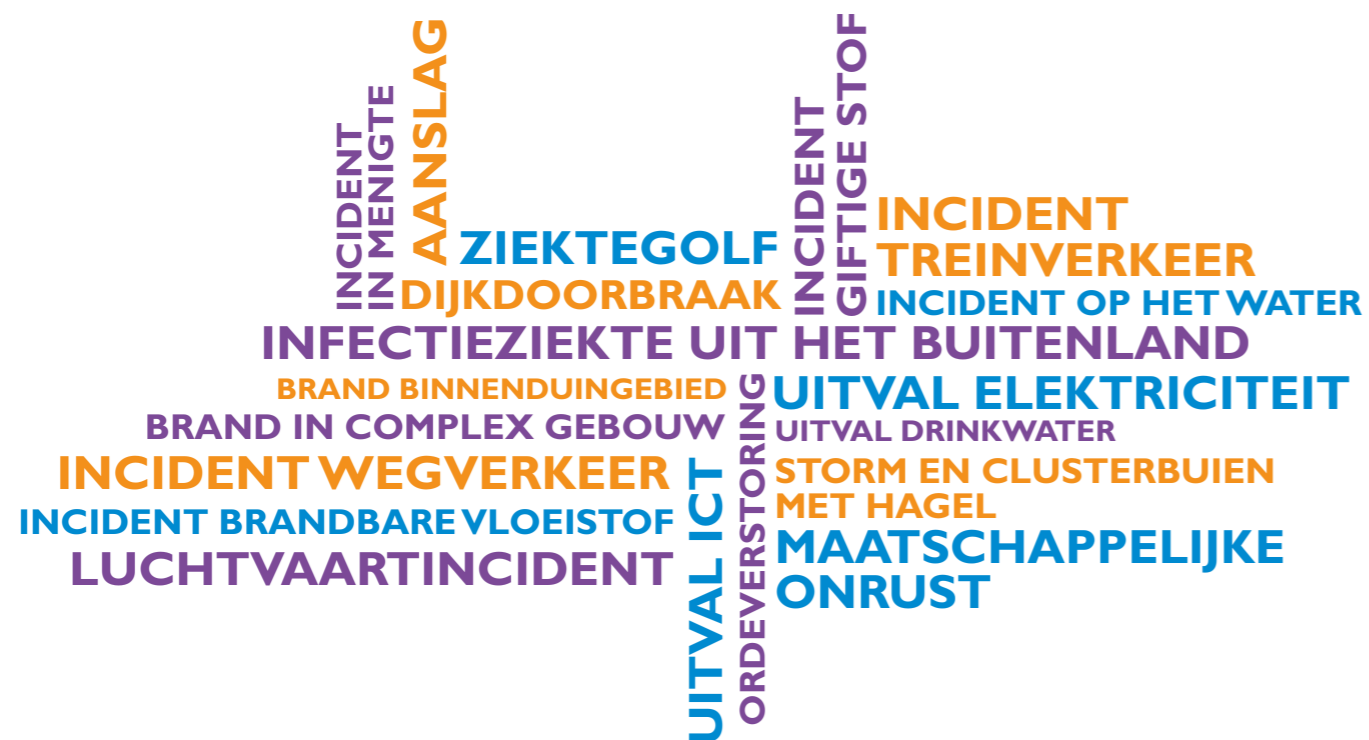
Onderzochte scenario's voor het regionaal risicoprofiel 2018